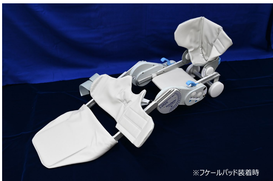
※フケールパッド装着時