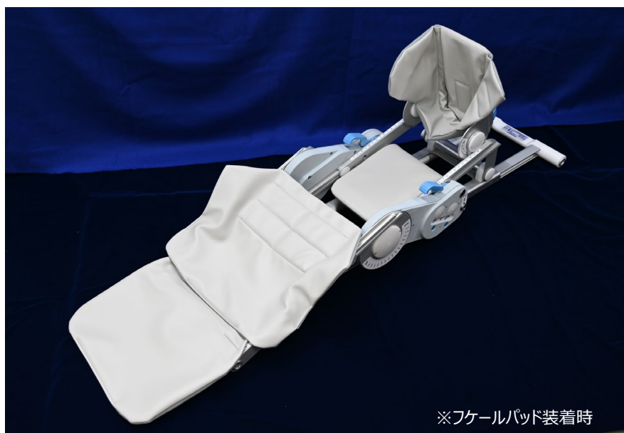
※フケールパッド装着時